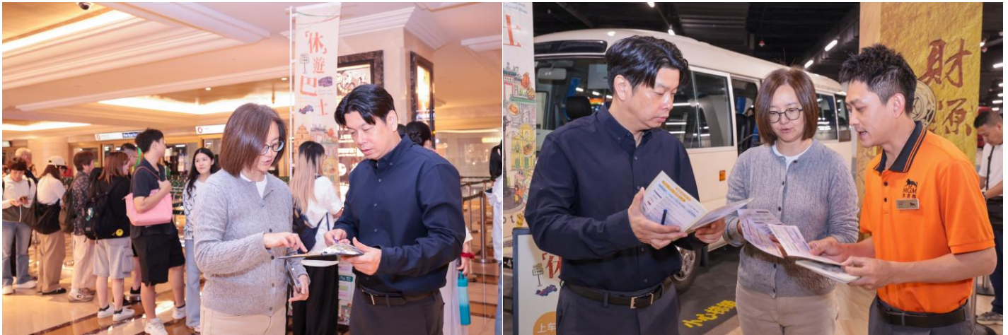
Verificação in loco do funcionamento e da organização no âmbito das acções de fiscalização interdepartamental conjunta nas paragens dos Autocarros de Turismo e “Lazer”