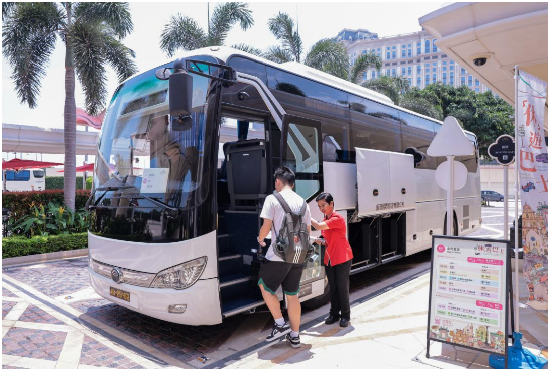
Colocação de painéis informativos nas paragens, por parte das empresas de lazer, para identificar a zona de tomada de passageiros