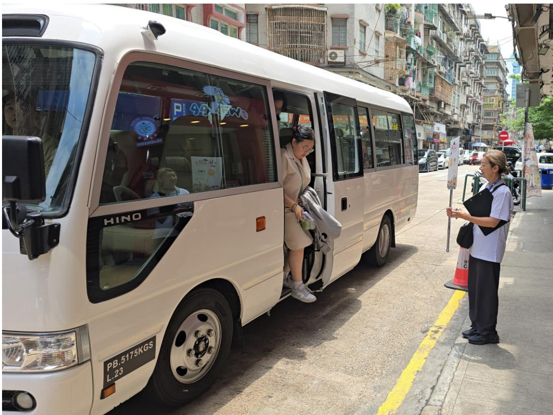
A DST destaca pessoal para a prestação de serviço nas paragens dos autocarros shuttle nos bairros comunitários