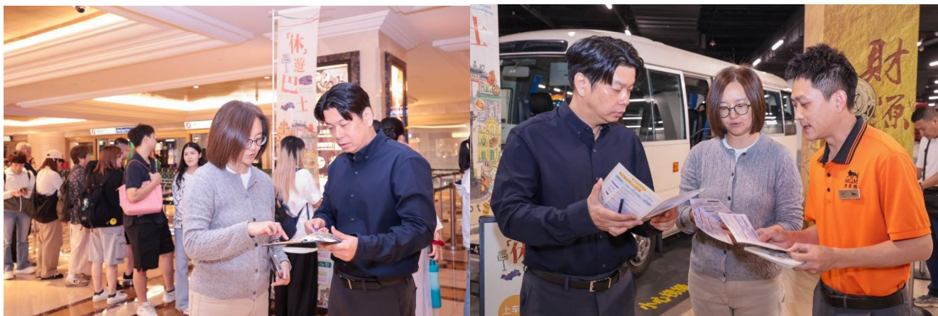
跨部門聯合巡查「休」遊巴士站點 實地檢視運作安排