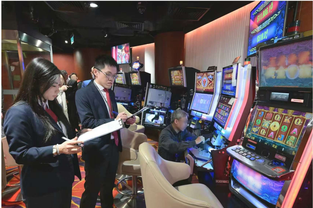
博監局進行停運程序