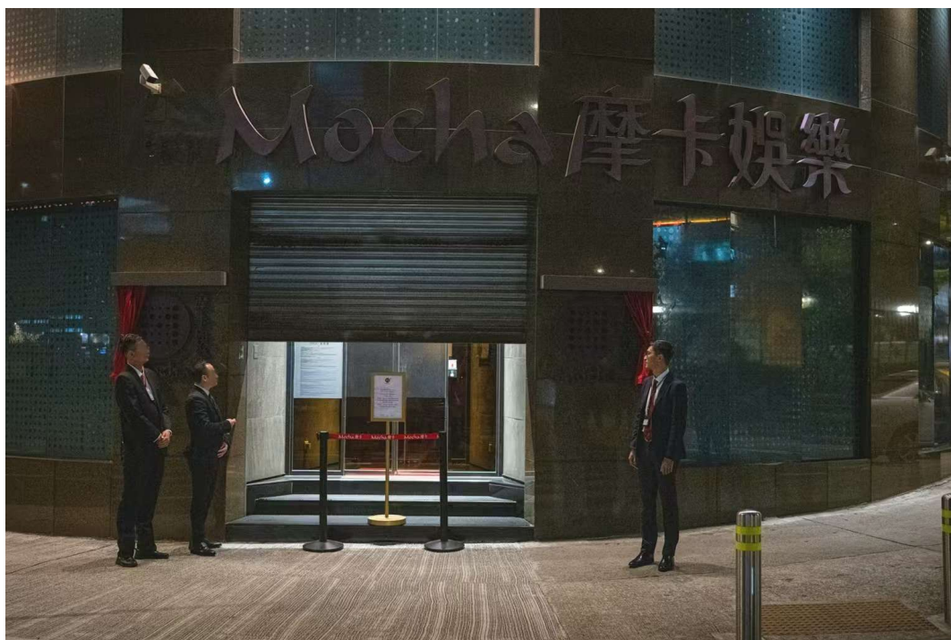
摩卡駿龍關閉入口