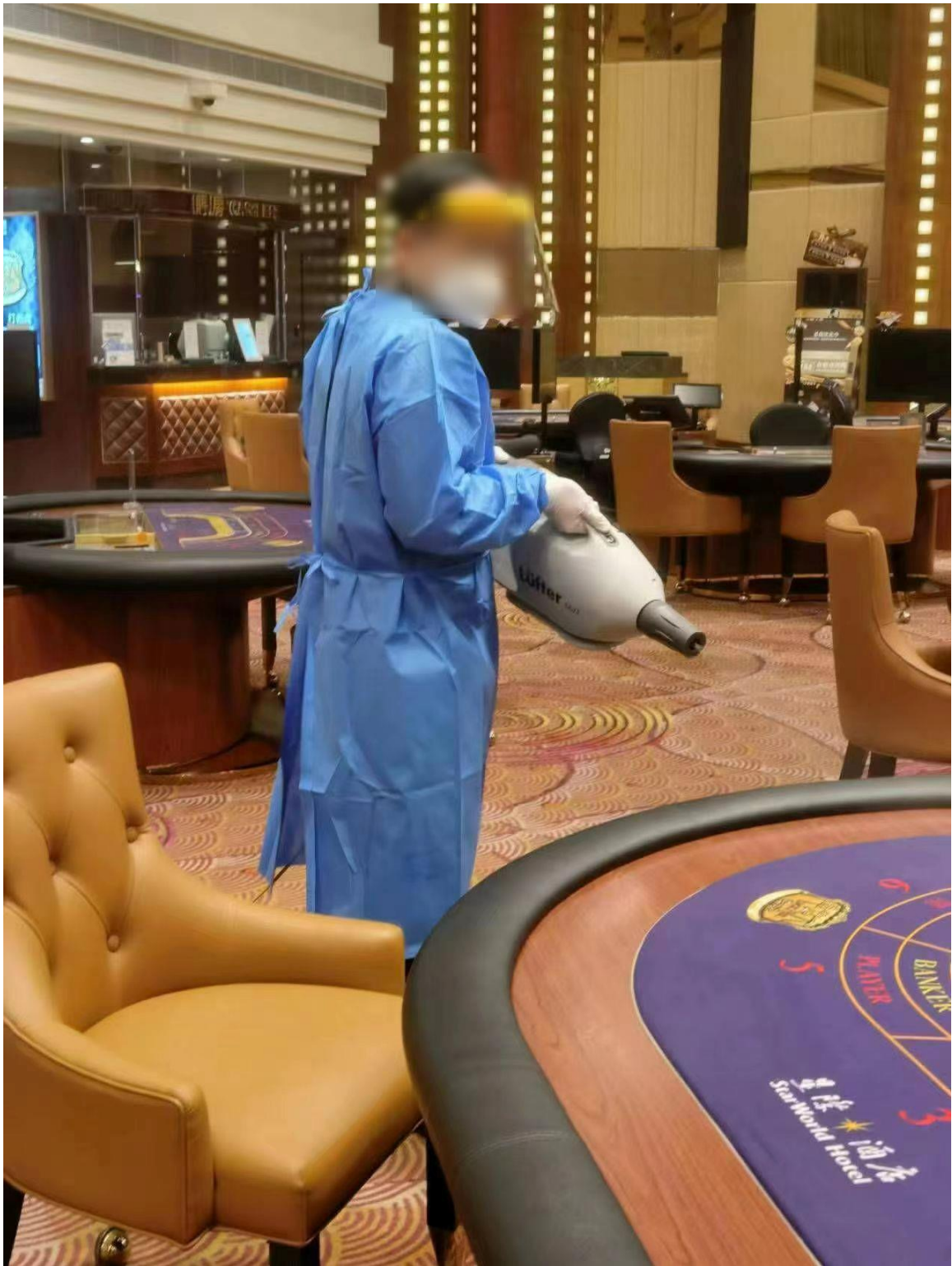
圖二:娛樂場復運前徹底清潔消毒