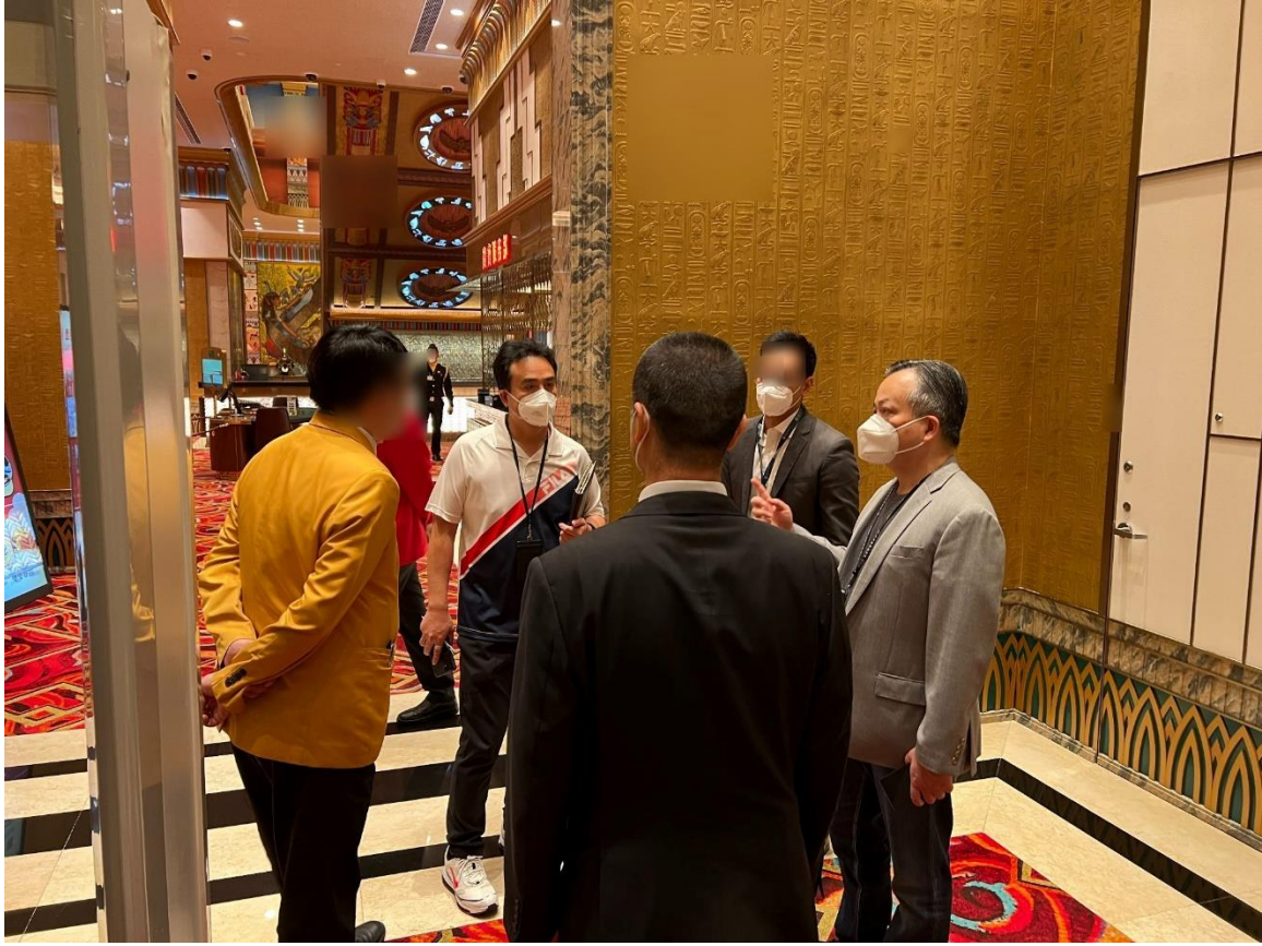
圖五：博監局人員巡查娛樂場落實各項防疫措施