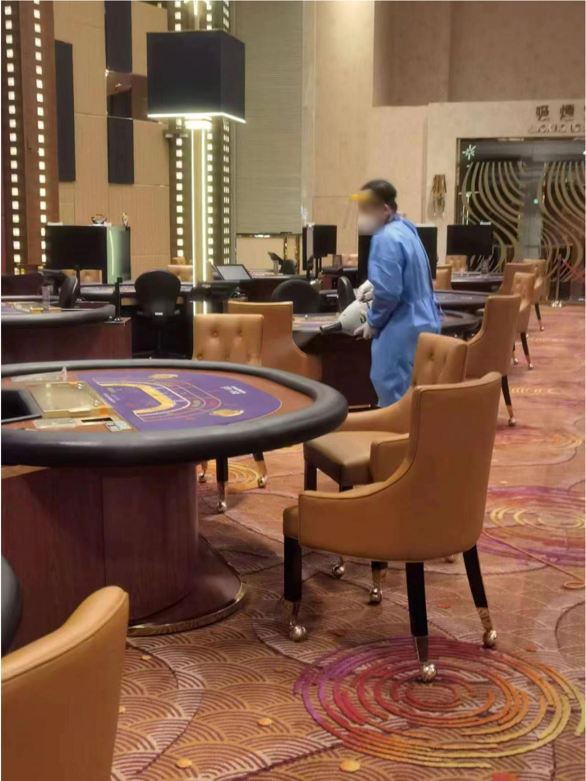
圖一：娛樂場復運前徹底清潔消毒