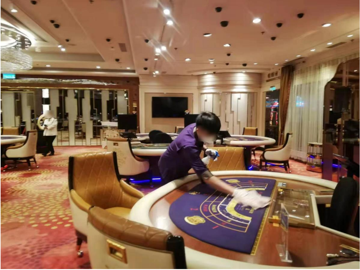
圖三：博彩員工加強清潔各項設備