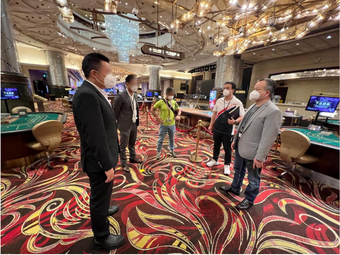
圖四：博監局人員敦促娛樂場做好開場準備