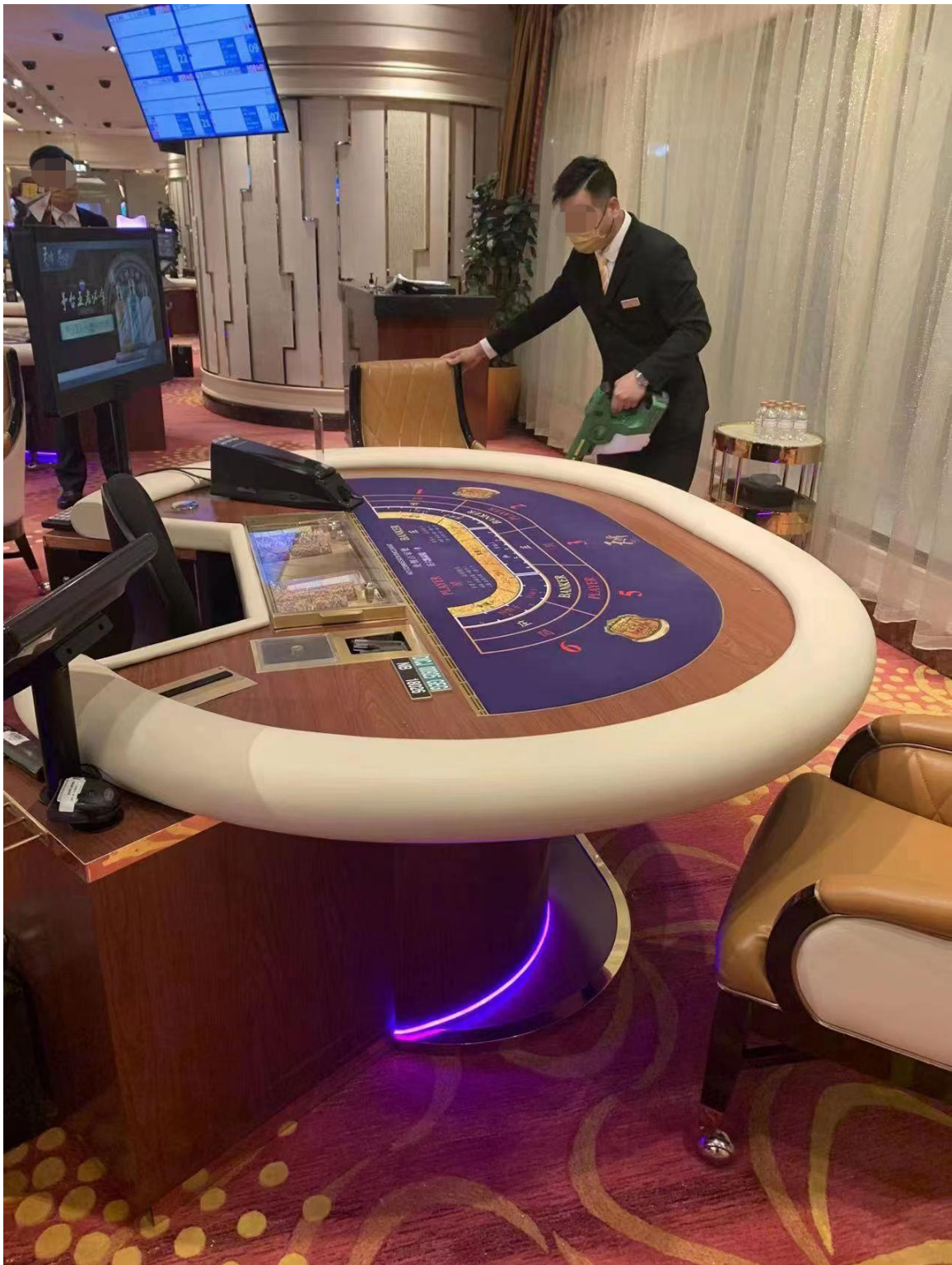
Pessoal dos casinos reforça os trabalhos de limpeza e desinfeção