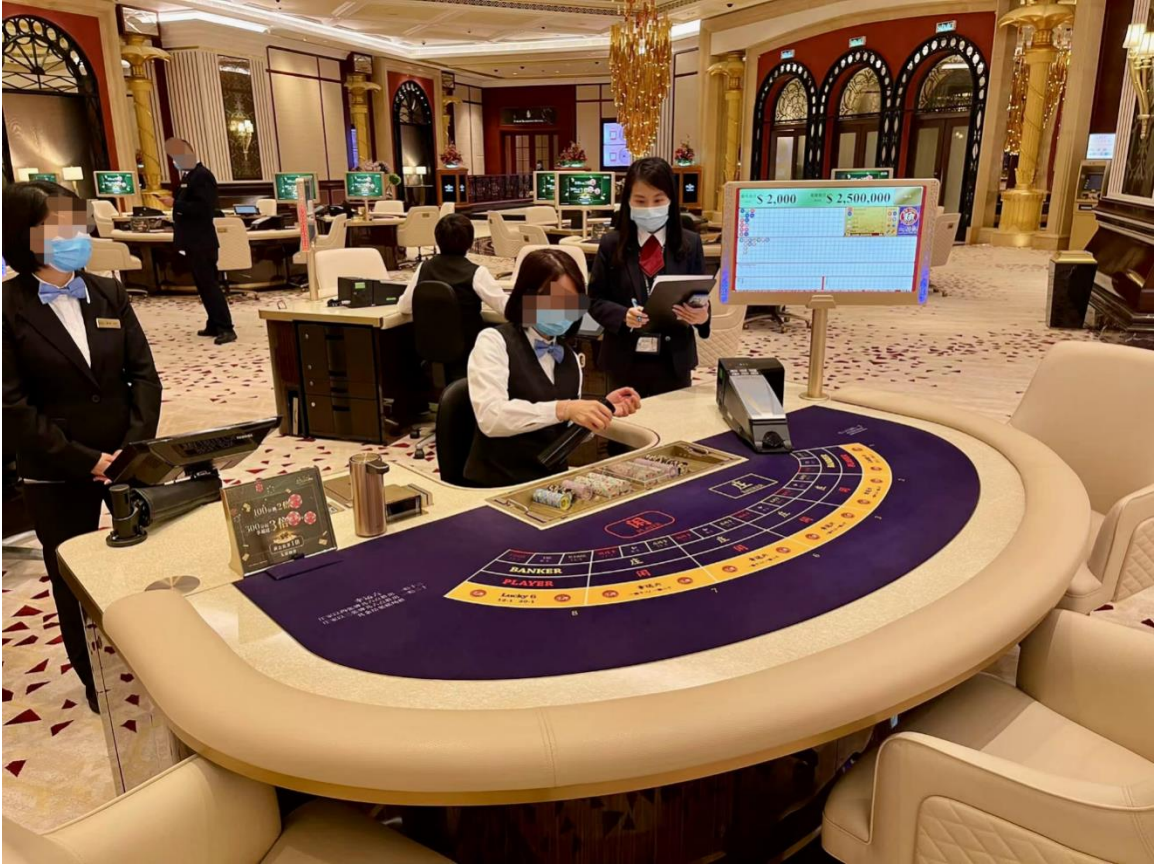
Croupier reforça a desinfeção das fichas