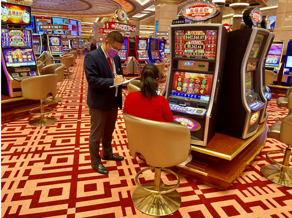
Inspector da DICJ verifica o código de saúde dos indivíduos no casino