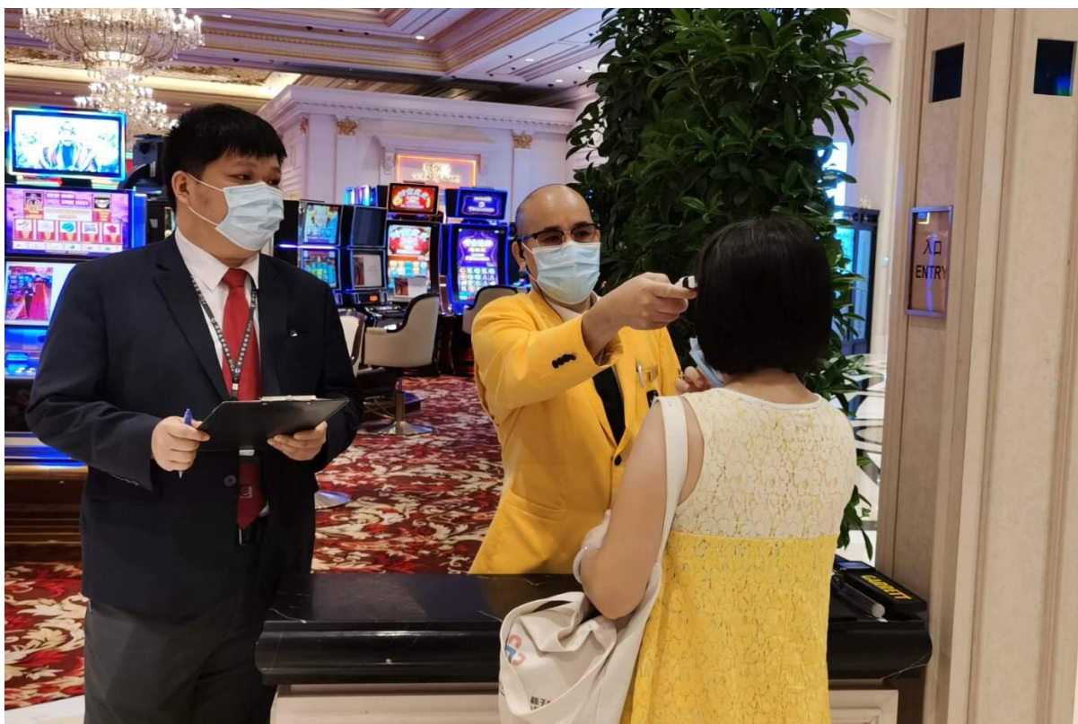
É efectuada medição de temperatura corporal aos visitantes, à entrada nos casinos.