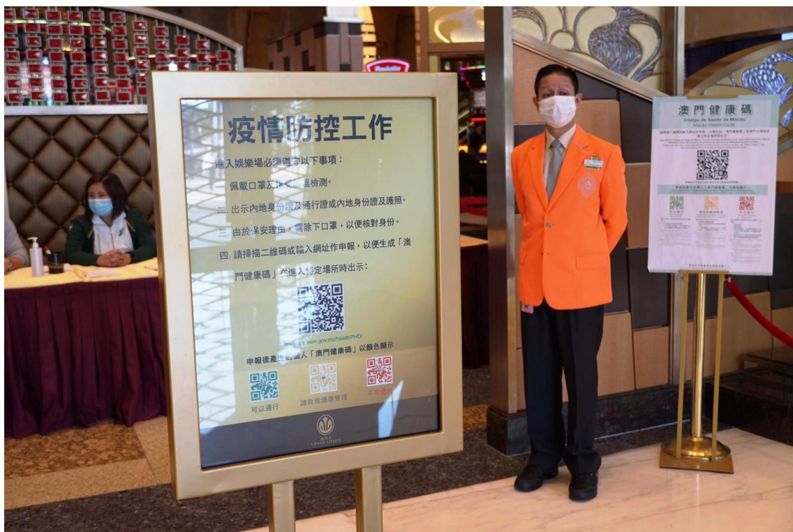
Encontram-se na entrada dos casinos expostos requisitos de prevenção de epidemias.