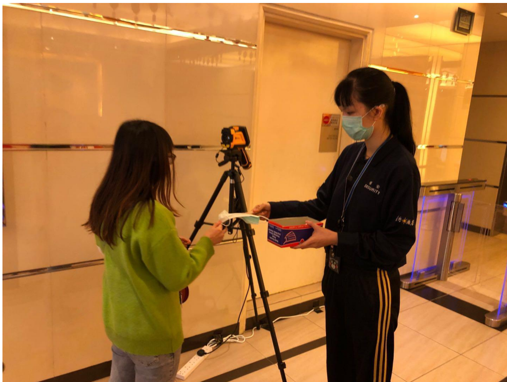
圖二：娛樂場向上班員工派發口罩