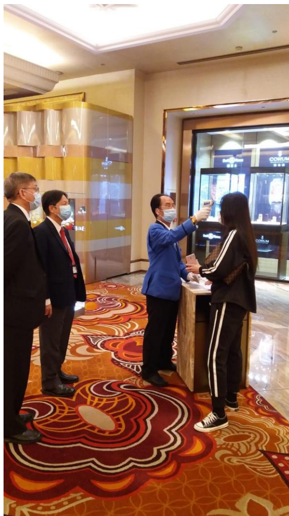
圖一：博監局督察人員加強巡查娛樂場防疫措施