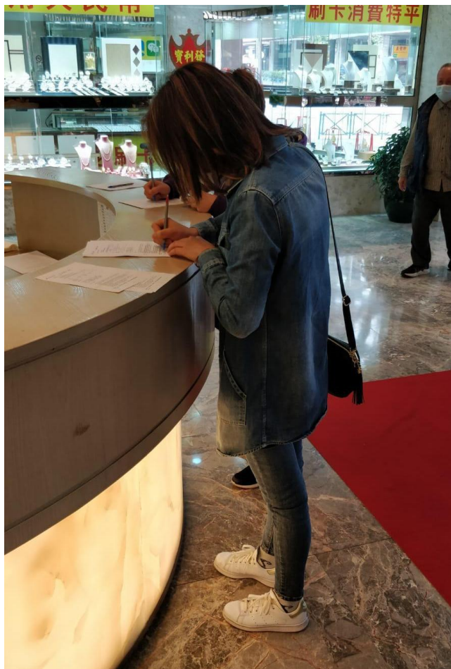
圖四: 進入娛樂場人士即場填寫健康聲明